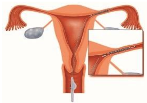
Figuur 2 Hysteroscopie volgens Essuremethode: Het afsluiten van de eileiders van binnenuit door middel van een soort veertje

In het OLVG wordt de kijkoperatie volgens de Essure-methode (zie figuur 2) gedaan. Bij de Essure-methode wordt een veertje, gemaakt van roestvrij staal, nikkel, titanium en dacronvezels, in de eileider geplaatst. Hierdoor groeien de eileiders in ongeveer drie maanden dicht.