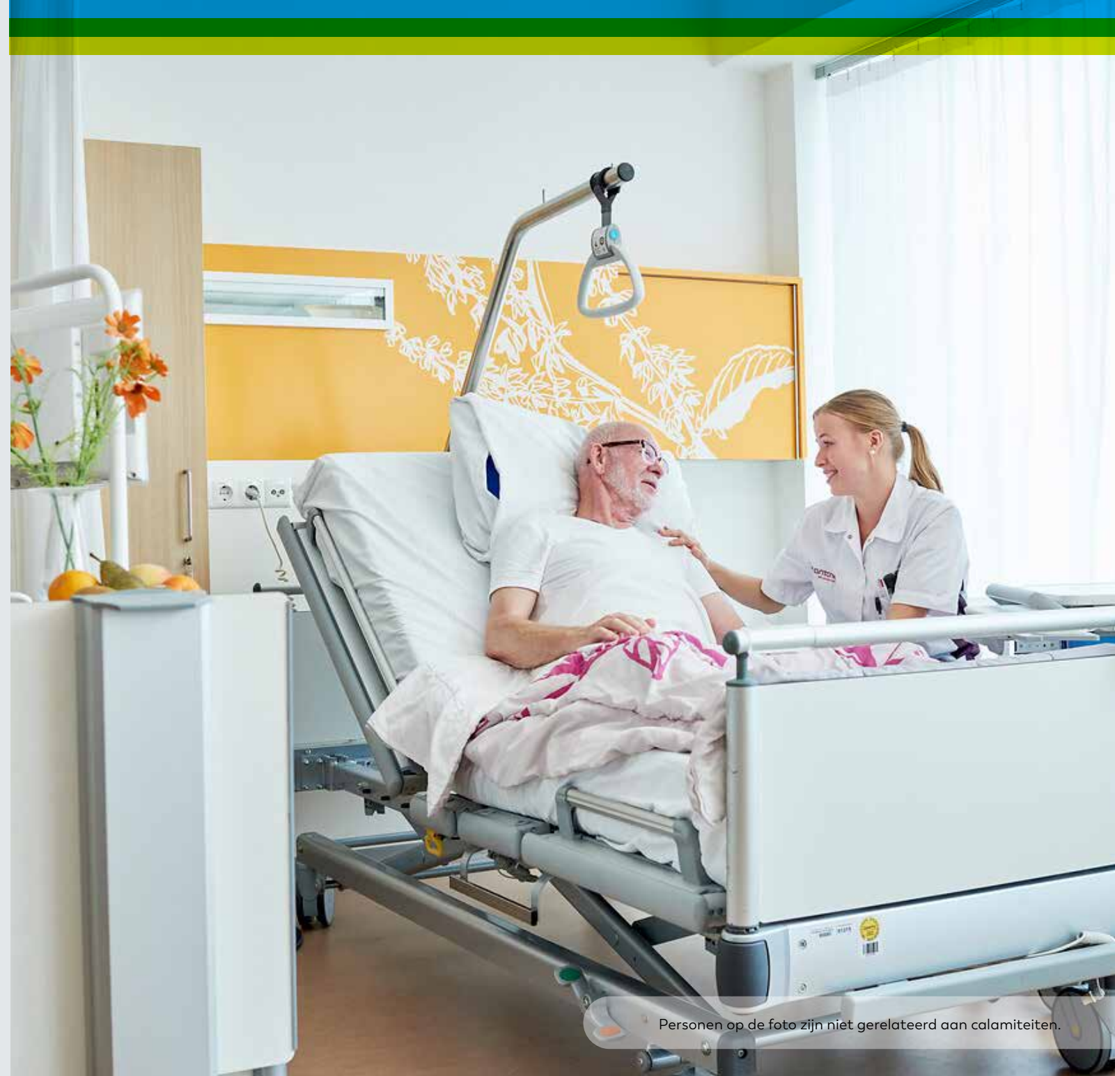
Personen op de foto zijn niet gerelateerd aan calamiteiten.