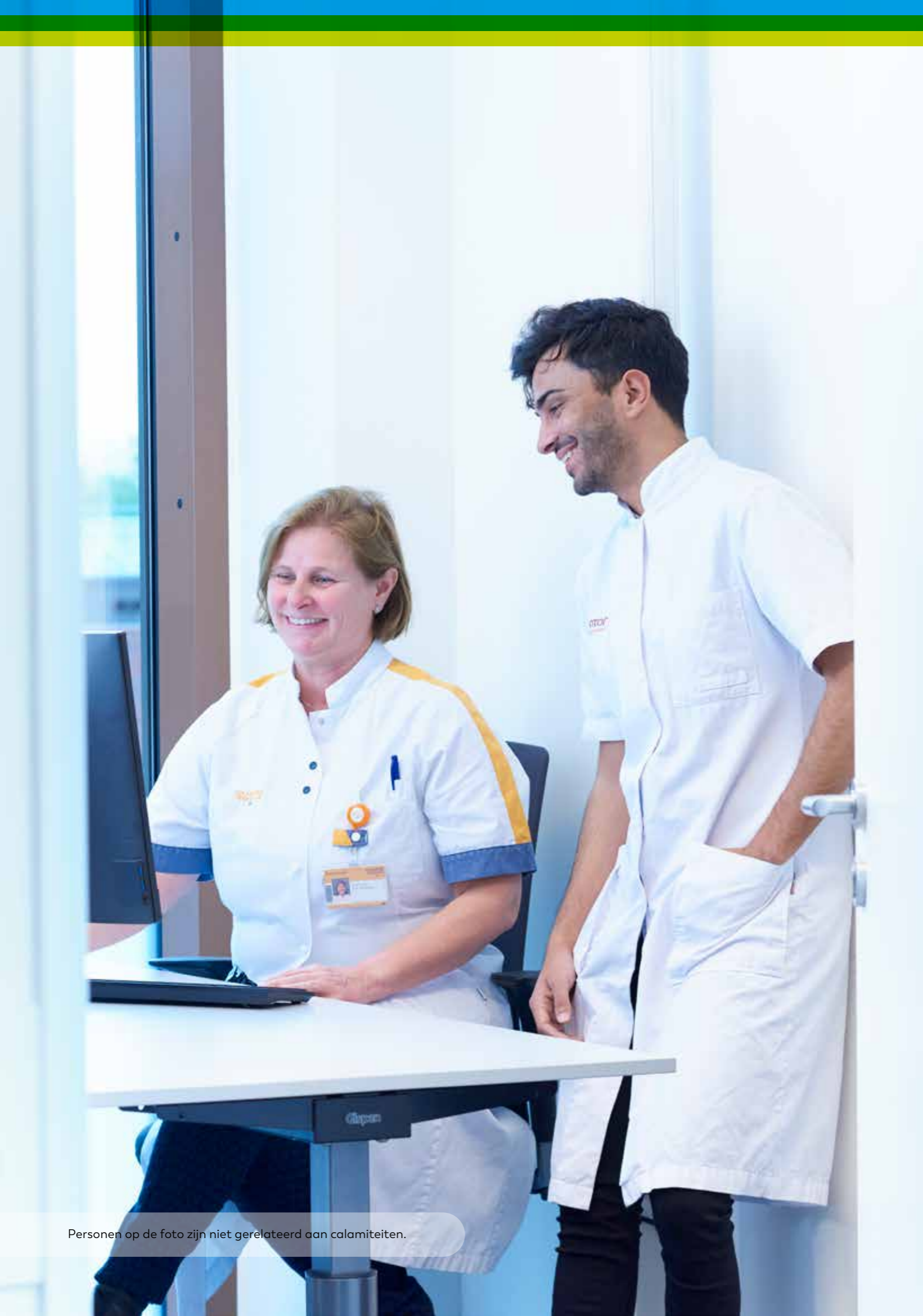
Personen op de foto zijn niet gerelateerd aan calamiteiten.