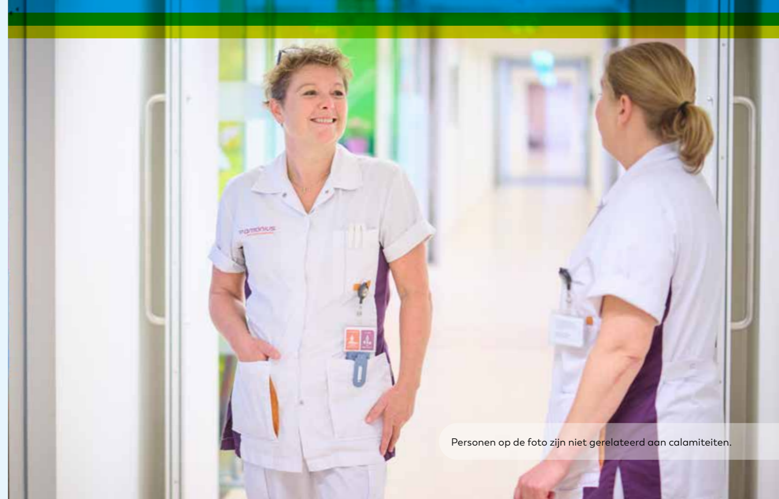
Personen op de foto zijn niet gerelateerd aan calamiteiten.