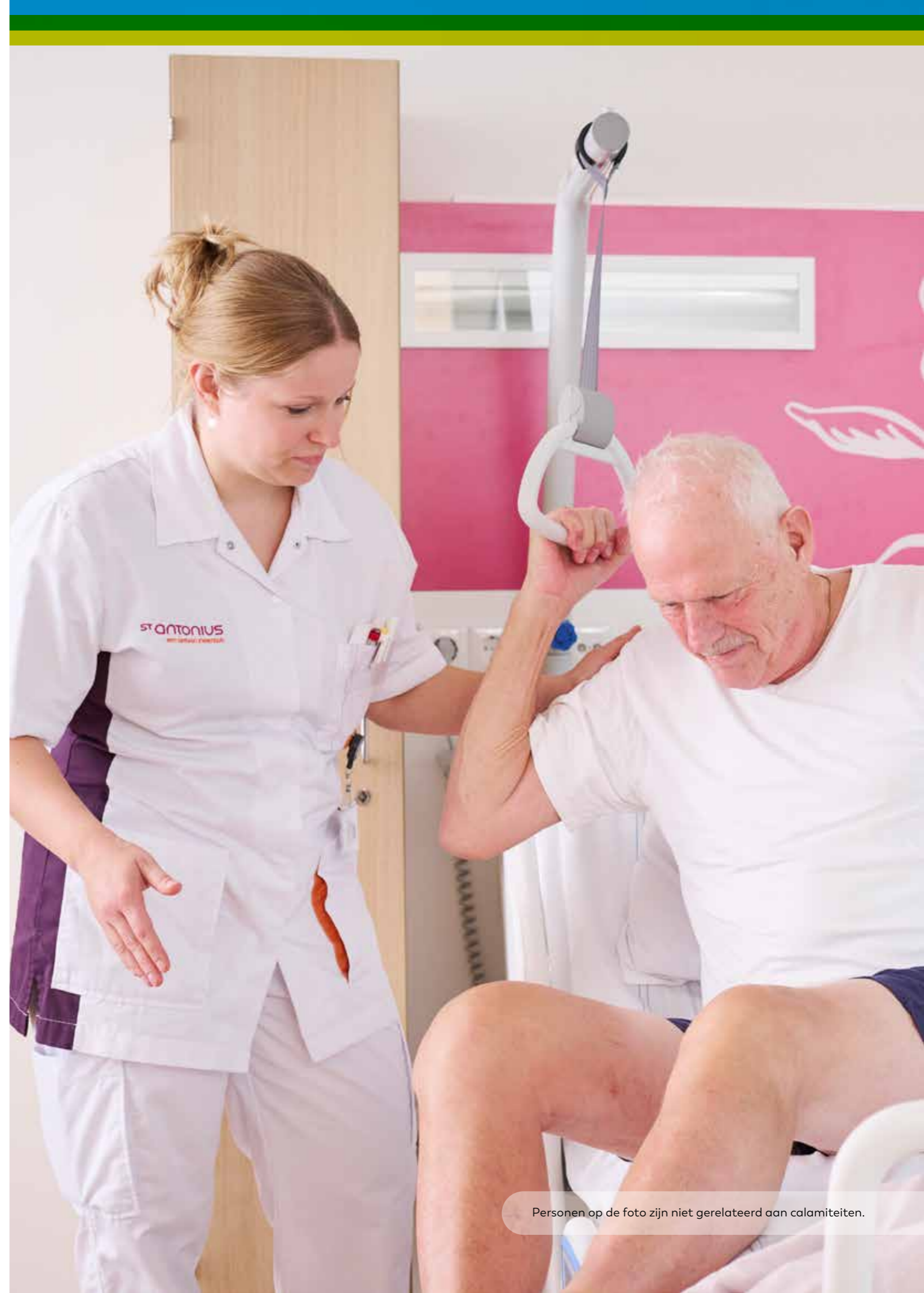
Personen op de foto zijn niet gerelateerd aan calamiteiten.