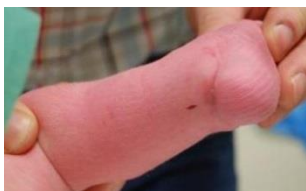
Litteken na ingreep achillespees

Na deze ingreep moet het beentje weer 3 weken in het gips. Daarna is achillespees weer op de juiste lengte aangegroeid en kan het gips er af. Nieuw gips is niet meer nodig. Achter op de hiel blijft een heel klein litteken over (ter grootte van een nietje).