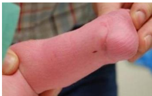
Litteken na ingreep achillespees

Na deze ingreep moet het beentje weer 3 weken in het gips. Daarna is achillespees weer op de juiste lengte aangegroeid en kan het gips er af. Nieuw gips is niet meer nodig. Achter op de hiel blijft een heel klein litteken over (ter grootte van een nietje).