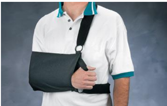
Afbeelding 1: sling